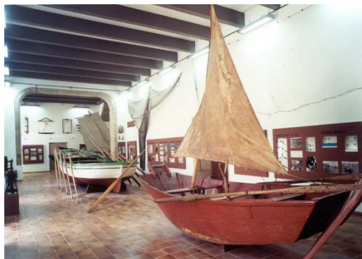
(Planta baixa, sala do mar)

Un traíña é unha rede que se usa nos barcos chamados traíñeiras . Imos á sala do mar ver como é. Para saber cal é temos que buscar o barco máis grande que se move con remos.