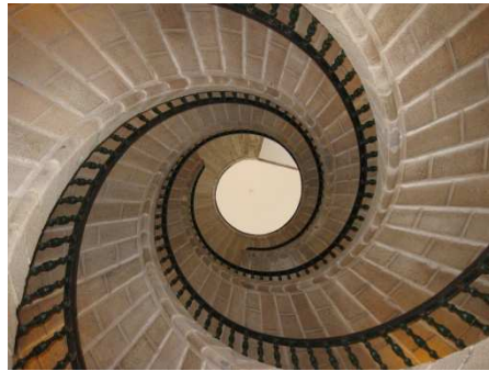
(Planta baixa, espazo contiguo á sala do mar)

Seu pai foi canteiro e dedicouse a traballar a pedra e facer moitas cousas. Neste edificio hai unha obra feita en pedra que é única no mundo, unha escaleira con forma de hélice, como a dos helicópteros! Imos buscala e contar cantas escaleiras hai.