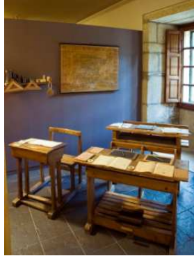
(Primeiro andar, sala de sociedade)