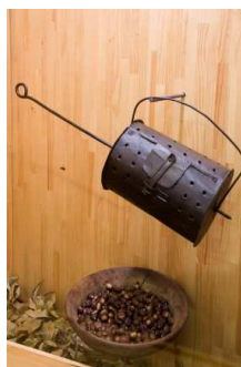
(Primeiro andar, sala de sociedade)

Outro tema sobre o que lle gustaba moito escribir eran as festas. Por exemplo ten libros sobre estás dúas festas que vedes nas fotos. Se queredes saber como se chaman, teredes que ir ao andar de arriba e atopalas! Vamos?