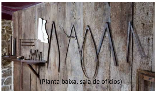
(Planta baixa, sala de oficios)