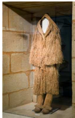
(Entreplanta, sala de indumentaria)

Fixádevos ben! Son tres e teñen números!! Vedes a nº III? Vamos subir por ela. Cando apareza a primeira porta temos que entrar e camiñar cara a dereita ata encontrar esta foto.