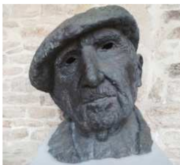
(Planta baixa, claustro do edificio)

Vamos procurar no Museo esta escultura. É dunha persoa moi importante, tanto, que este ano dedícanlle o Día das Letras Galegas. Sabedes quen é?