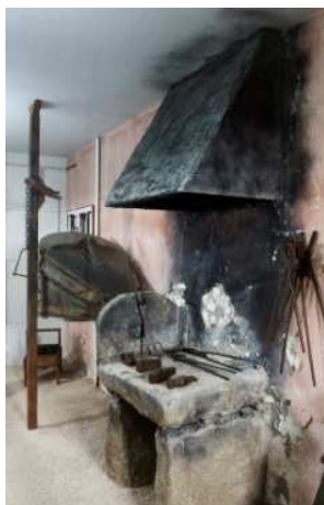
(Planta baixa, sala de oficios)

Se queremos sabelo, hai que ir á sala de Oficios e buscar esta foto. ↓ Imos?