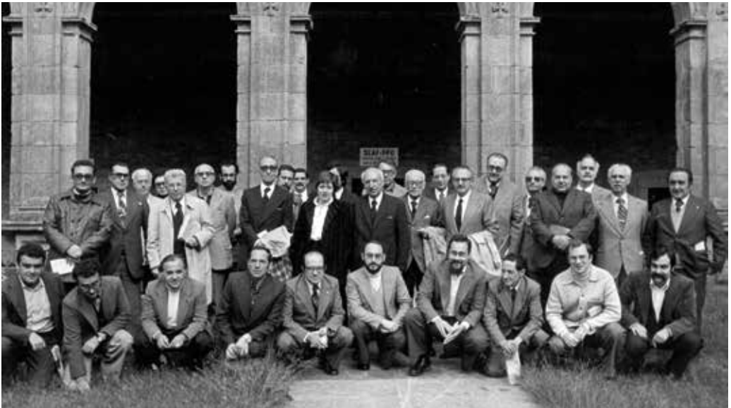
O primeiro Padroado, con algúns dos asistentes á inauguración do MPG no claustro de Bonaval. 1977.