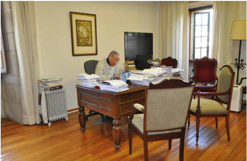
No seu despacho. 2017.

Puidemos facer máis? Sen dúbida. Pero tamén puidemos facer menos, ou nada, sobre todo se non estivera Carlos, a quen lle debemos gran parte do conseguido. Adeus, amigo.