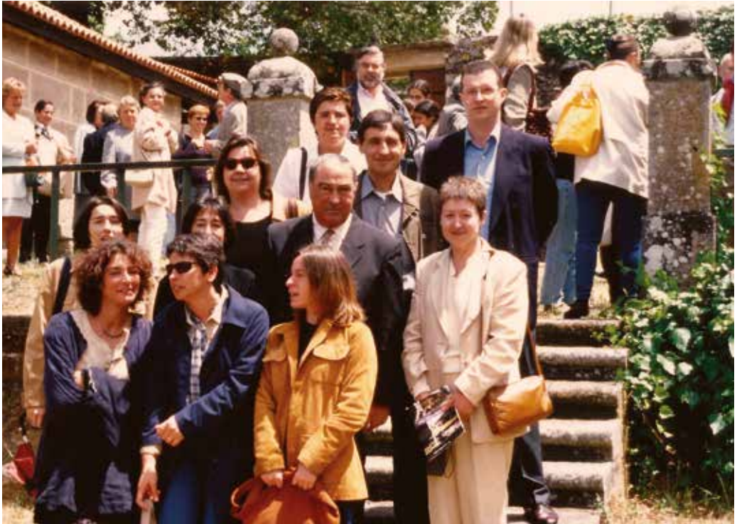
Co persoal do MPG na entrega do premio Traslaba. 1999